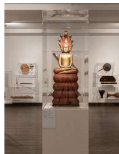
Salle Cambodge avec Bouddha Devanagari