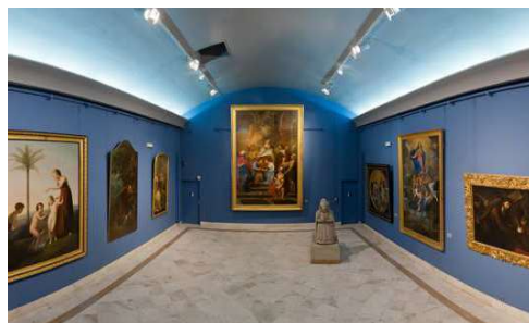
Salle Grands formats. Vue générale

Enfin, la section Art de l'Asie du Sud-Est , entièrement rénovée en 2020, présente un pan de la collection rassemblée par l'Alençonnais Adhémard Lelcère (1853-1917), résident de France au Cambodge de 1886 à 1910 pendant le Protectorat. Ce fonds, composé de près de 1 200 pièces, figure parmi les collections de référence pour l'étude de la culture khmère.