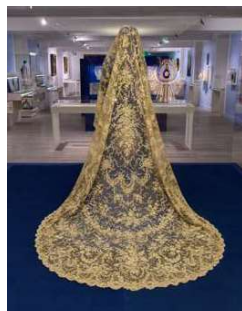
Salle Dentelle avec voile de mariée